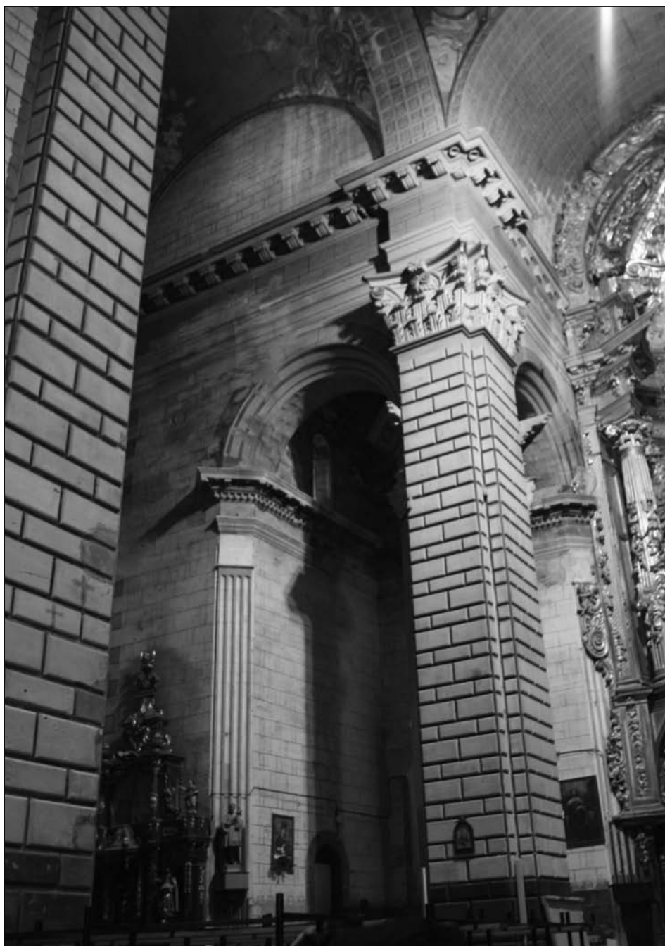
Fig. 3. Lerín. Parroquia de Nuestra Señora de la Asunción. Capilla colateral izquierda.