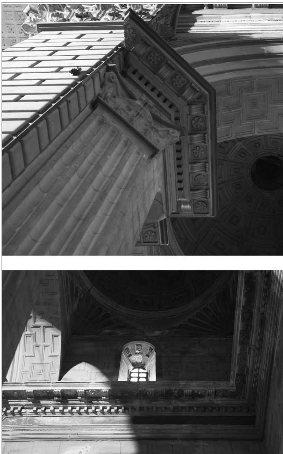
Fig. 4. Lerín. Parroquia de Nuestra Señora de la Asunción. Capilla colateral derecha. Detalle de la cornisa.