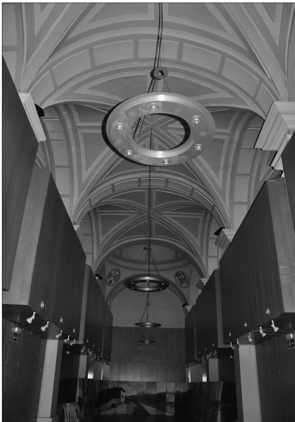
Figura 4. Interior de la iglesia del antiguo colegio de la Anunciada de Pamplona, actual albergue de peregrinos.

ocurió en el caso de los obradores de Bruselas en el Seiscentos. El fundador donó asimismo al centro educativo dieciocho guadamecés dorados y plateados «a manera de cordon de San Francisco, para que sirvan en las fiestas y adorno de la yglesia del dicho Collegio» 34 (fig. 4).