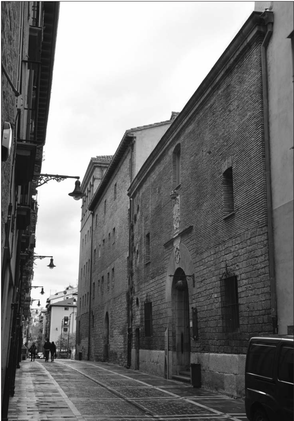
Figura 3. Fachada exterior del antiguo Colegio de la Anunciada de Pamplona.

de los angeles con muchas rosas y flores sembradas por el campo, asi mesmo el quadro de Nuestra Señora que llaman de la piedad, y assi mesmo el quadro de San Francisco de Asis que esta al natural en mi casa de Yriete, y el quadro del descendimiento de la cruz quando que llevaban a Christo al sepulcro 15 .