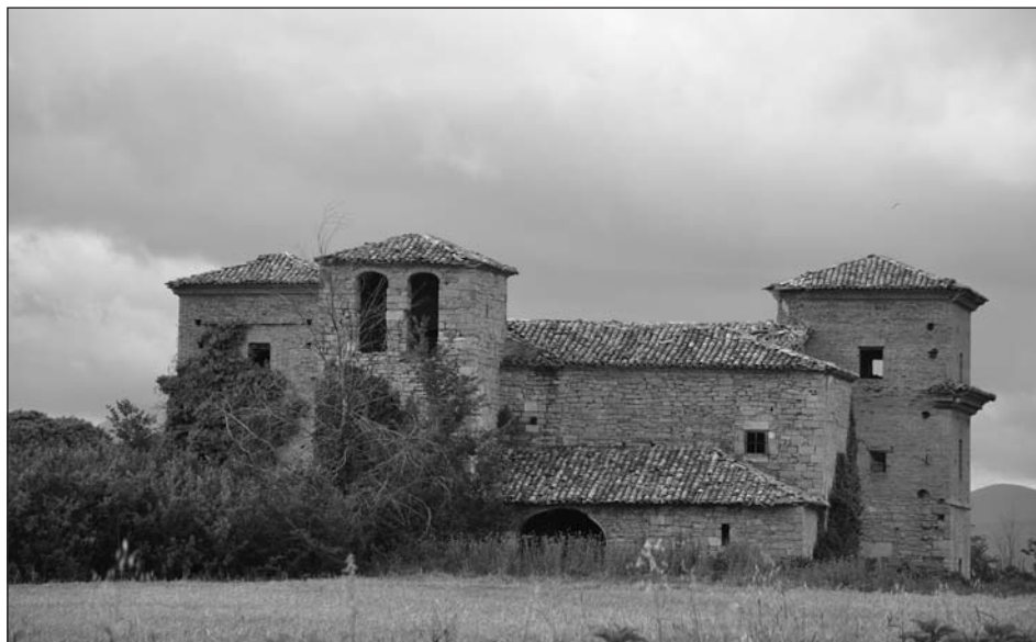
Figura 2. Iglesia de San Adrián de Eriete, en la que fue sepultado inicialmente Juan Piñeiro.

Juan Piñeiro falleció del 14 de junio de 1582 en su casa de Eriete, siendo sepultado en el templo parroquial de la localidad (fig. 2) 13 . Una vez construida la iglesia provisional del centro educativo jesuita en la capital navarra, sus restos mortales fueron trasladados al mismo, de acuerdo con sus últimas voluntades 14 .